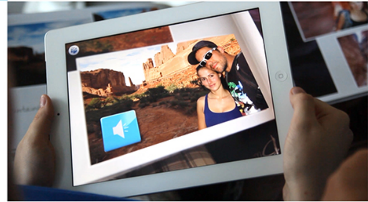
Fotos mit eigener Stimme kommentieren

MoviePic ist eine innovative Lösung zur multimedialen Ergänzung von Fotobüchern, die Ihren Kunden einen zeitgemäßen, attraktiven Mehrwert bietet und das klassisch gedruckte Fotobuch in ein lebendiges Archiv für persönliche Videos und Audiokommentare verwandelt, die die Fotos passend ergänzen. Die MoviePic-Lösung bietet dabei Ihren Kunden eine perfekte Brücke zwischen dem klassisch gedruckten und lieb gewonnenen Fotobuch mit all seinen haptischen und physischen Vorteilen und den inzwischen quer durch alle Altersgruppen genutzten iPhones, iPads oder Android-Smartphones Ihrer Kunden, mit all ihren heutigen multimedialen technischen Möglichkeiten. Die MoviePic-App wird dabei als White-Label-Basistechnologie in Abstimmung an Ihr Corporate Design angepasst und steht Ihren Kunden kostenfrei als iOS und Android-Version im jeweils passenden Appstore bereit.