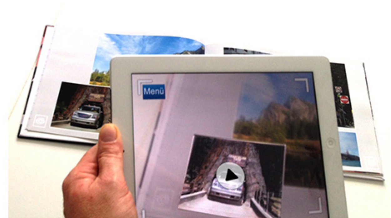
Videos werden in das Fotobuch eingeblendet

Über das persönliche Passwort wird die App mit den individuellen Medien geladen und ergänzt so das jeweilige Fotobuch mit Videos, Slideshows und selbst gesprochenen Audiokommentaren. Über einen Aktivierungs-Code erhalten Ihre Kunden Zugang zu ihrem persönlichen, dem jeweiligen Fotobuch zugeordneten Videomaterial.